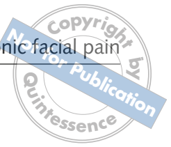
Table 3 The categories established on the basis of the interview text material.