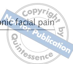
Table 1 The reductive technique of qualitative content analysis 33 illustrated by an example.